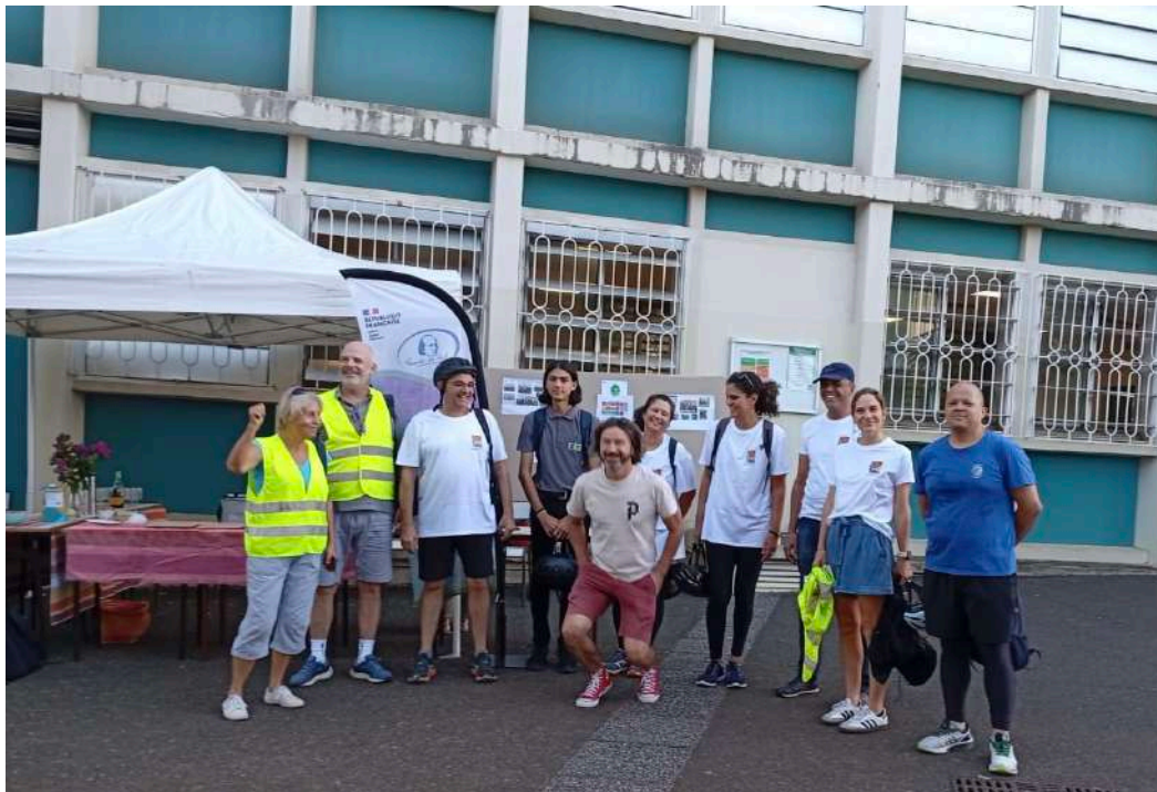
Départ du lycée Leconte de Lisle

Cette année, une délégation composée de 7 enseignants du lycée Geoffroy et de 4 enseignants du lycée Leconte de Lisle a participé à l'opération nationale « Mai à vélo ». Tout au long de la matinée, nous avons sillonné les rues de Saint-Denis à vélo à assistance électrique.