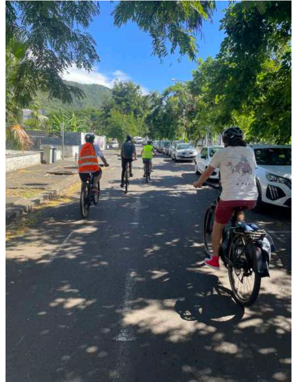
En route vers la dernière étape : le collège Jules Reydellet