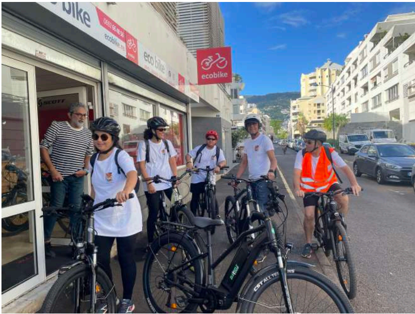
Départ du Butor après les dernières consignes.